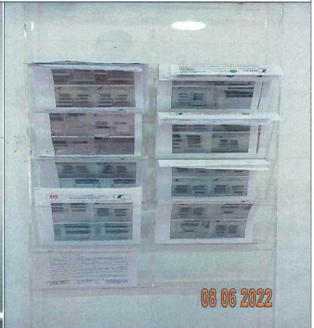
EDICTOS DE LA P_07258 YC-CRT-115356